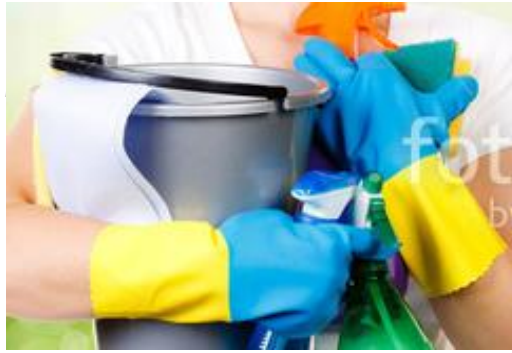
Hausreinigung Zubereitung von Mahlzeiten