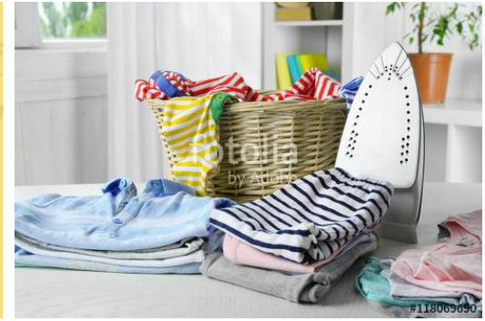
Kleidungs- und Wäschepflege Bügelservice